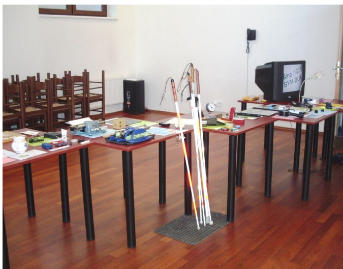
Vystavené kompenzační pomůcky při příležitosti dne otevřených dveří

Při vchodu do vestibulu byla prezenze a doprovodná hudba Hudců z Kyjova, na začátku prezenze hráli na nádvoří ústavu, po zahájení DOD ve vestibulu.