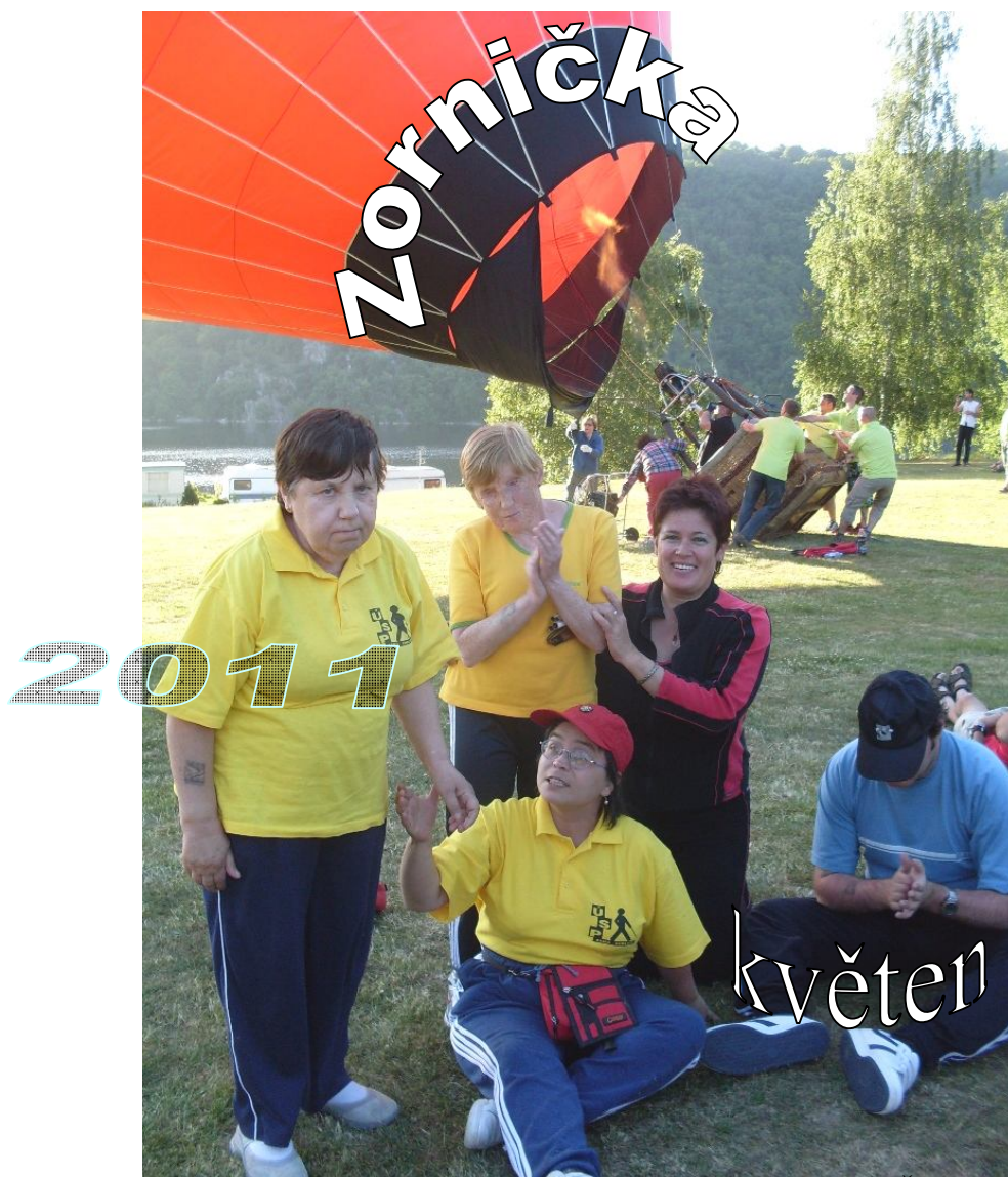
Naši sportovci v Nové Zivohošti